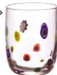
Millefiori di Leonardo

Per sottolineare minerali di alto lignaggio, come la Chateldon che Luigi XIV si faceva portare in botti a Versailles dalla sorgente di Puy-de-Dôme.