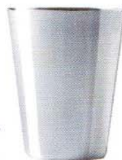
Bicchiere conico di Dabbene

Flûte da Champagne, per apprezzare il perlage: da quello fitto delle minerali nettamente frizzanti a quello rado delle meno vivaci.