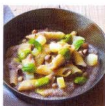
LAURETANA Leggermente frizzante

Estremamente leggera, fresca, con bollicine delicate e poco spinte, è ideale per accompagnare quei piatti la cui delicatezza esclude teoricamente il vino. Cioè le verdure di stagione al naturale, i cereali e i legumi.