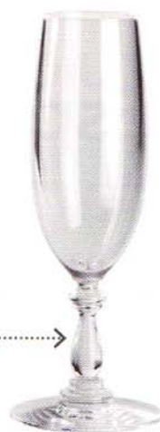
Dressed di Alessi

Se ogni vino ha il suo bicchiere, questo è vero anche per l'acqua, soprattutto per le minerali, che sono tutte ricche di storia e di personalità.