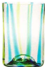
Tirache di Zafferano

Con decorazioni di fiori, erbe, frutta. Per acque di grande leggerezza e purezza gustativa, sgorgate da sorgenti in alta montagna.