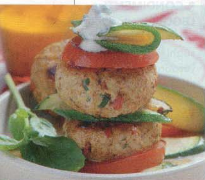
HAMBURGER DI SOIA