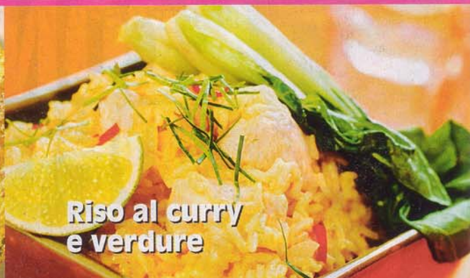
Riso al curry e verdure