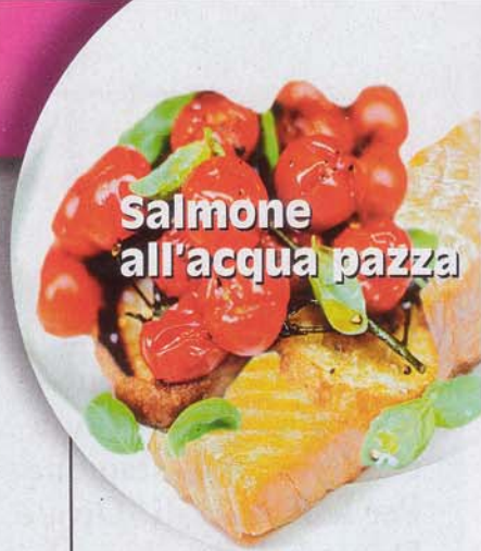
Salmone all'acqua pazza

• Caffè o tè con dolcificante • 1 bicchiere di latte parzialmente scremato o