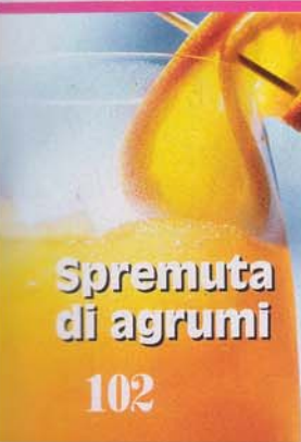
Spremuta di agrumi