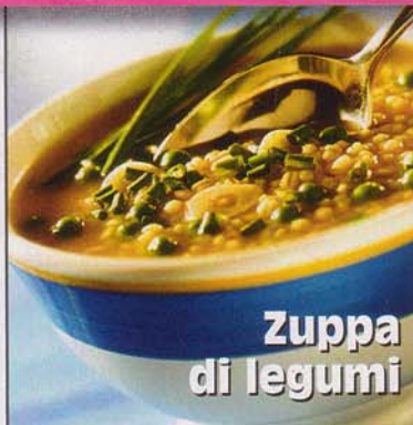
Zuppa di legumi

Esecuzione: lavate bene le verdure, tagliate a metà i pomodorini e privateli dell'ac-