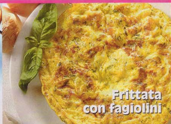
Frittata con fagiolini