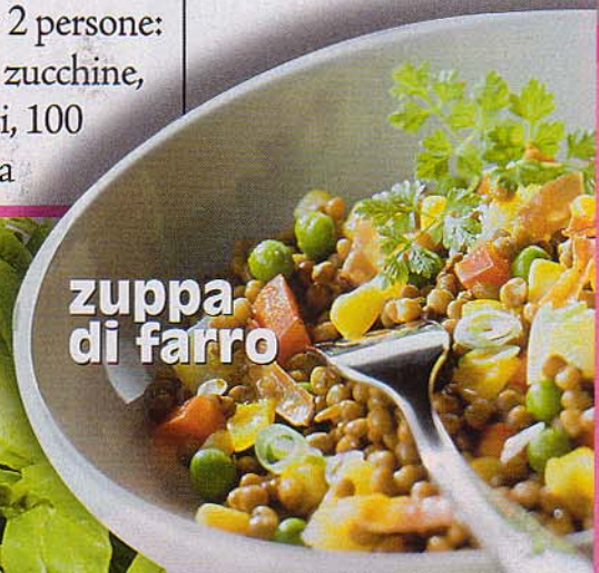
zuppa di farro