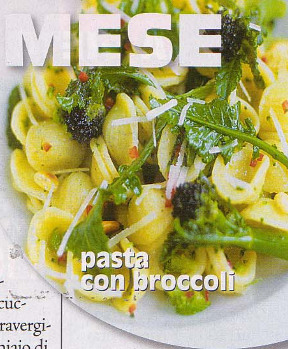
pasta con broccoli

Esecuzione: pulite le verdure e ponetele con il dado in una pentola piena a metà d'acqua. Portate a cottura, aggiungete l'olio d'oliva, il parmigiano, il sale e mettete il tutto nel frullatore. Cuocete la pasta al dente e versatela in una zuppiera insieme al passato di verdura. Regolate di sale e servite tiepido.