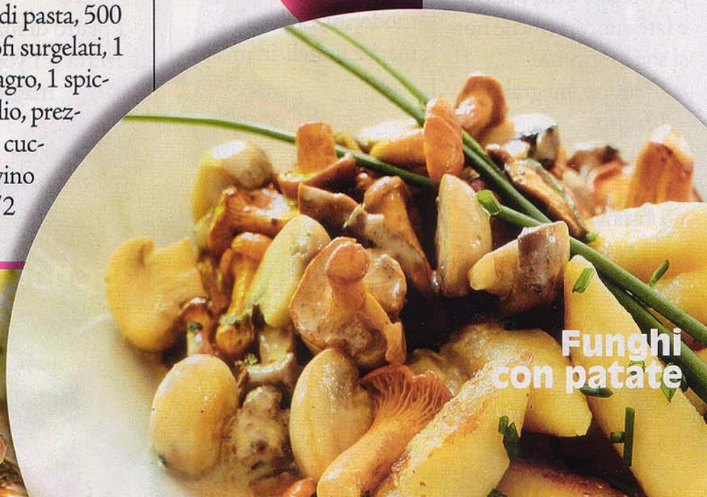
Funghi con patate