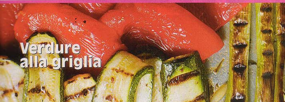
Verdure alla griglia