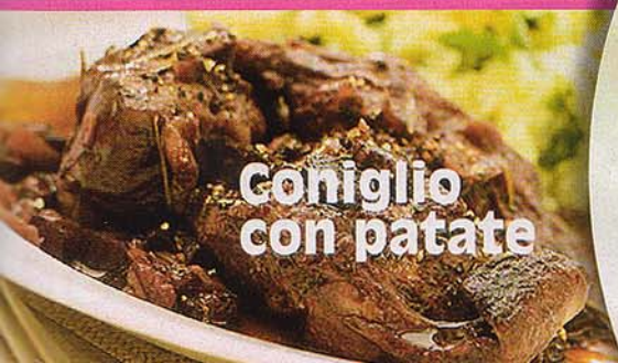
Coniglio con patate