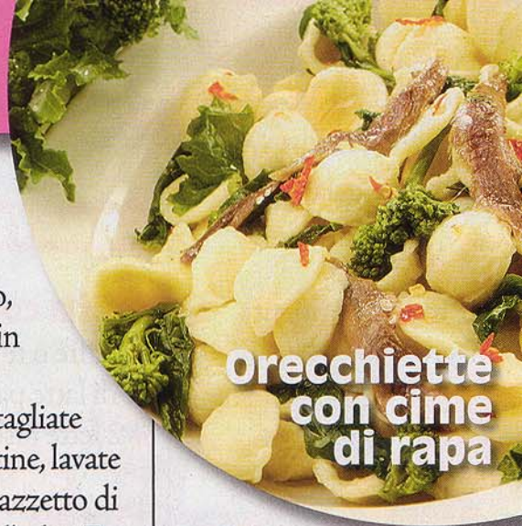
Orecchiette con cime di rapa

sugo di carciofi. Mescolate bene e aggiungete il peperoncino in polvere e il parmigiano.