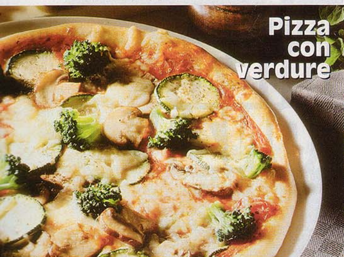
Pizza con verdure