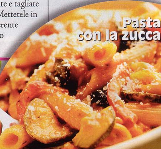
Pasta con la zucca