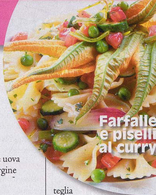
Farfalle e piselli al curry

Esecuzione: lavate il salmone e mettetelo in una